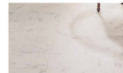
③ クッションフロア 施工例