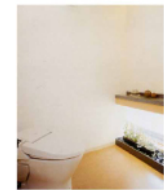
⑤ 壁紙 施工例