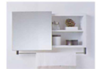
④ スライド鏡付 埋込収納