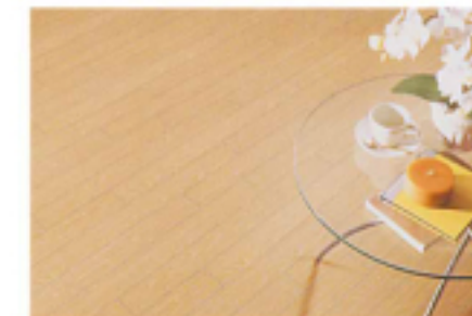
⑤ 硬質塩ビタイル (木目調) 施工例