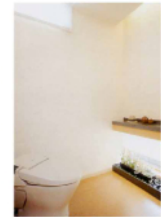
⑧ 壁紙 施工例